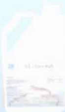
DẦU GAN MỰC®