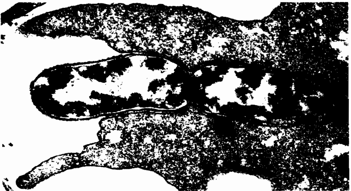
ĐẠI THỰC BÀO được quét bằng KÍNH HIỂN VI ĐIỆN TỬ

Tác nhân gây bệnh bị đại thực bào bao bọc và cơ chất Lysozym phân hủy.