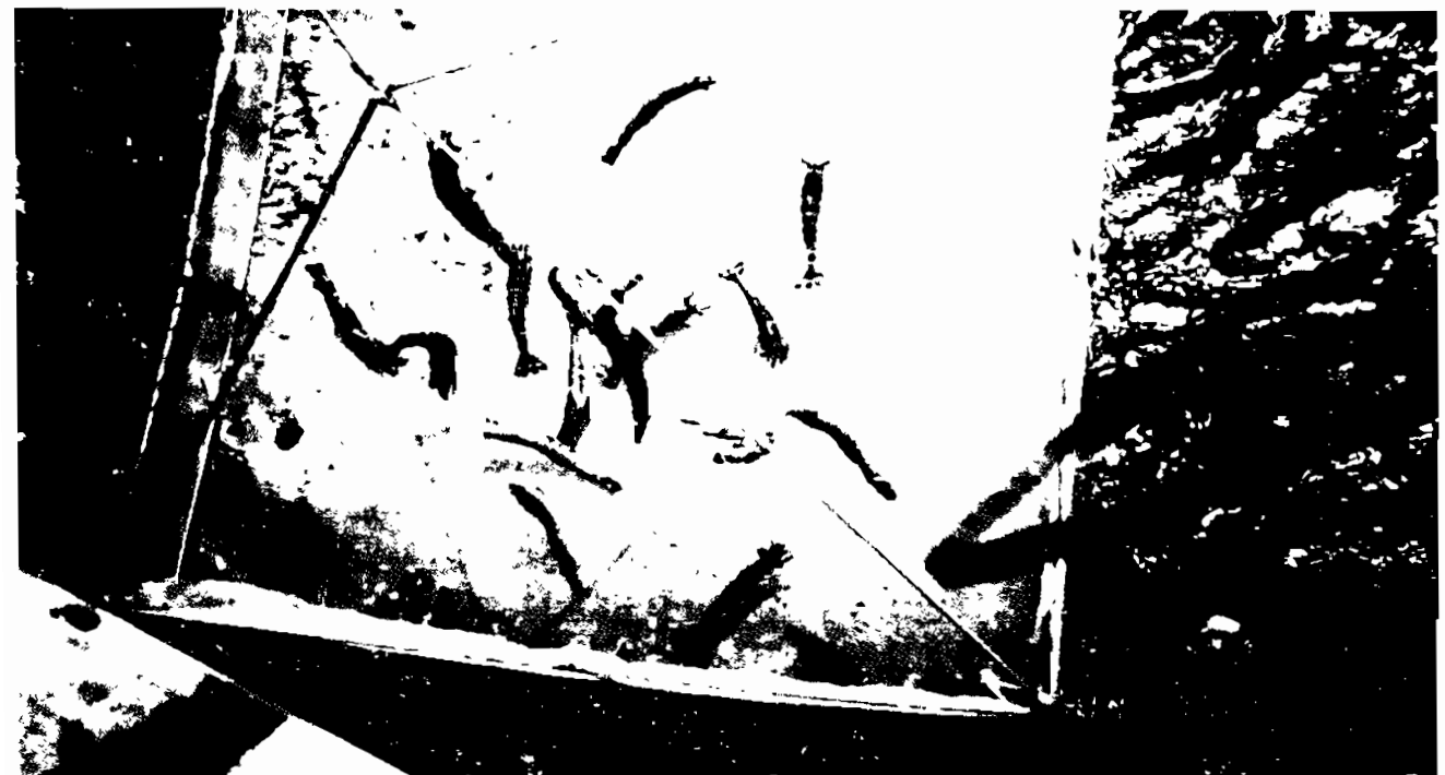
TÔM KHOẺ MẠNH KHI THỬ NHÁ