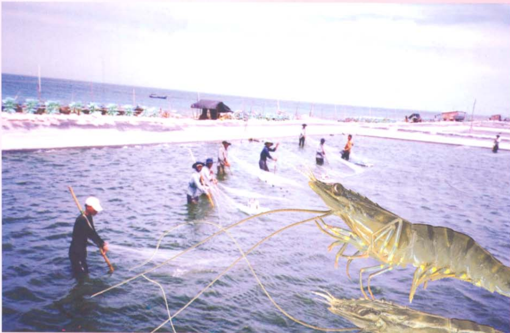
Đang thu hoạch Tôm